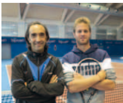
Ravagni e Adami