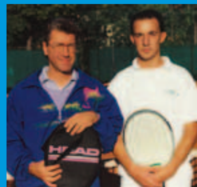
Boscato e Manica

Questo è un piccolo riassunto del torneo sociale e dei suoi maggiori protagonisti che hanno così scritto un pezzo di storia del nostro circolo.