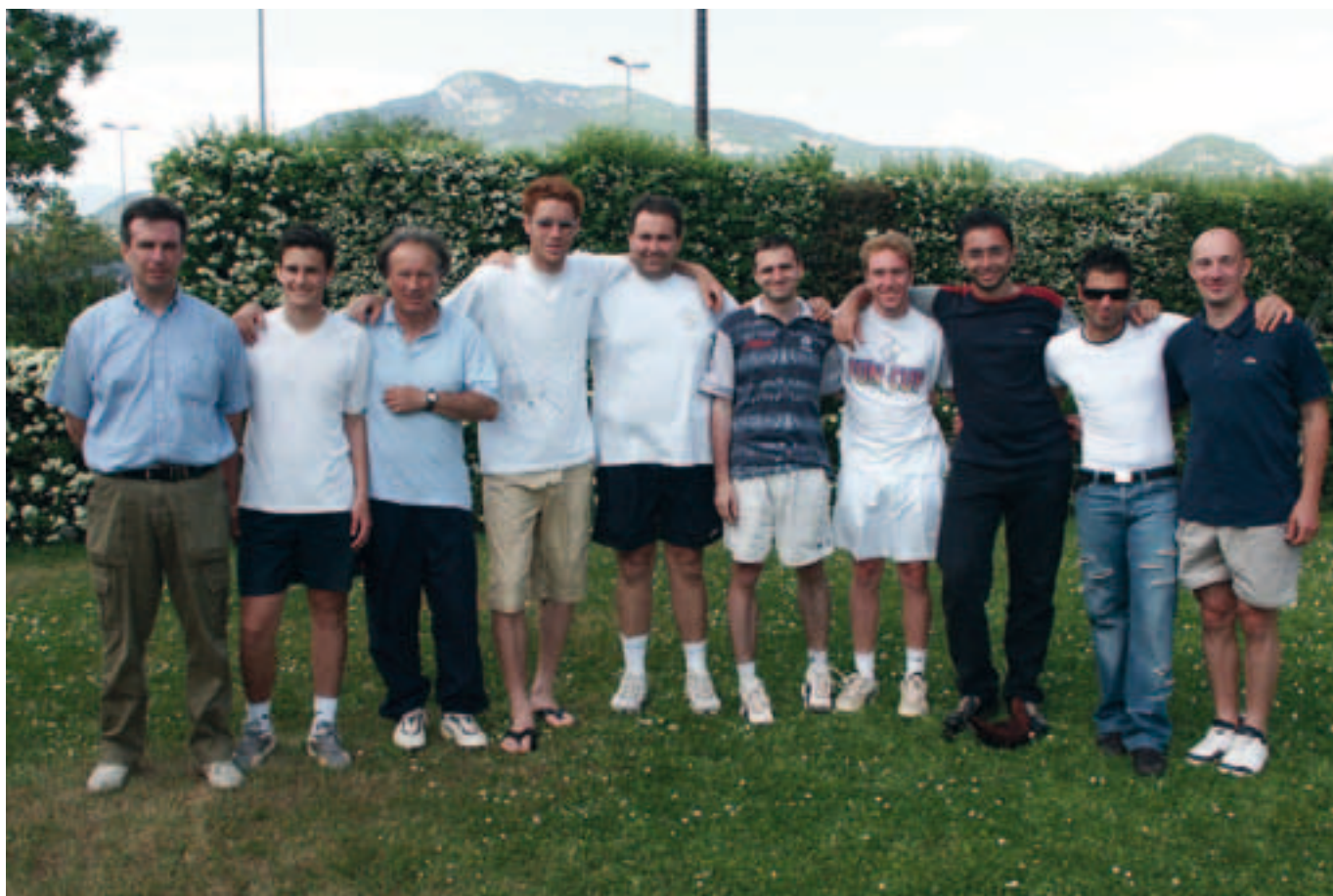
2003, la storica formazione che si aggiudicò il campionato Trentino di Serie C maschile