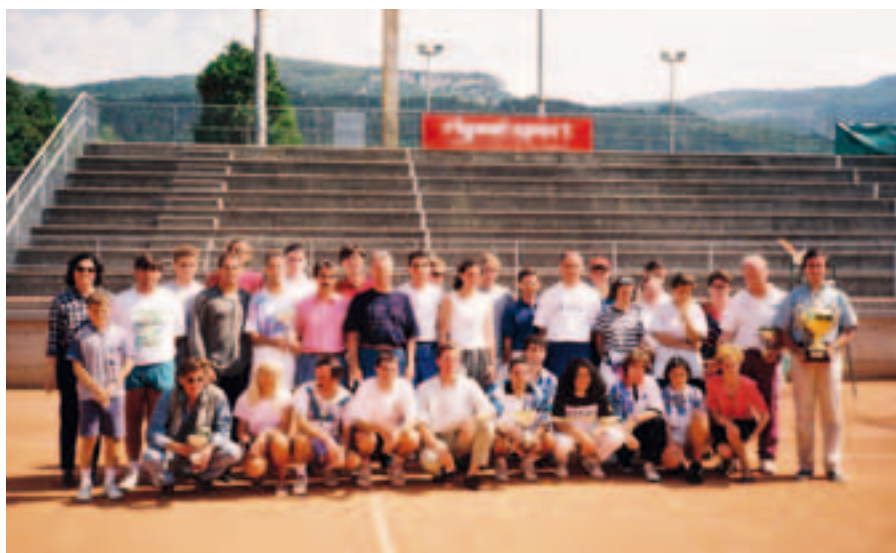
1995, C10 Cup con la partecipazione del circolo gemellato di Caprese

Nel corso del tempo, siamo anche riusciti a stabilire rapporti di amicizia e collaborazione con club