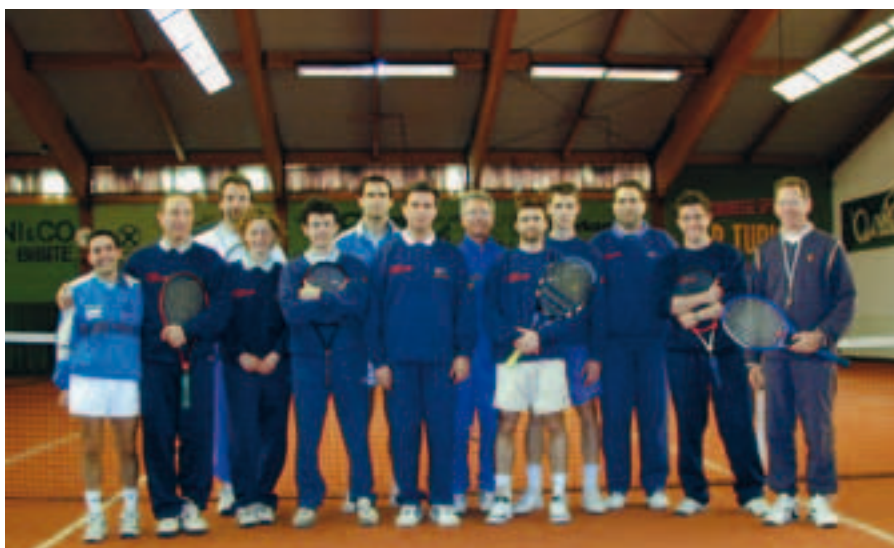
2000, il club festeggia la vittoria della Winter Tennis Cup a Marlengo

Veniamo ora agli ultimi anni di vita del nostro club. Nel 2011, anno in cui abbiamo festeggiato i 25 anni di vita dell’associazione organizzando a fine settembre sui campi della Baldresca l’incontro a squadre tra Slovenia e Italia, si sono verificate delle serie difficoltà. È mutato infatti l’atteggiamento dell’amministrazione comunale