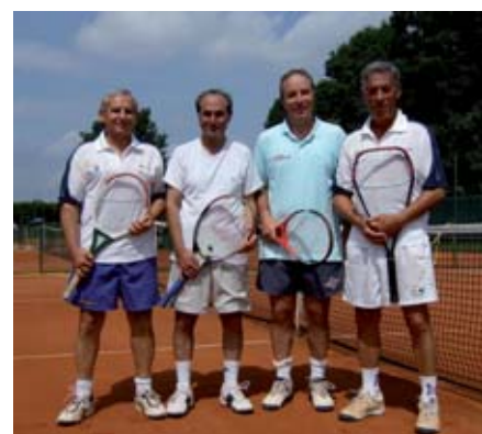
I protagonisti del match di Vigevano