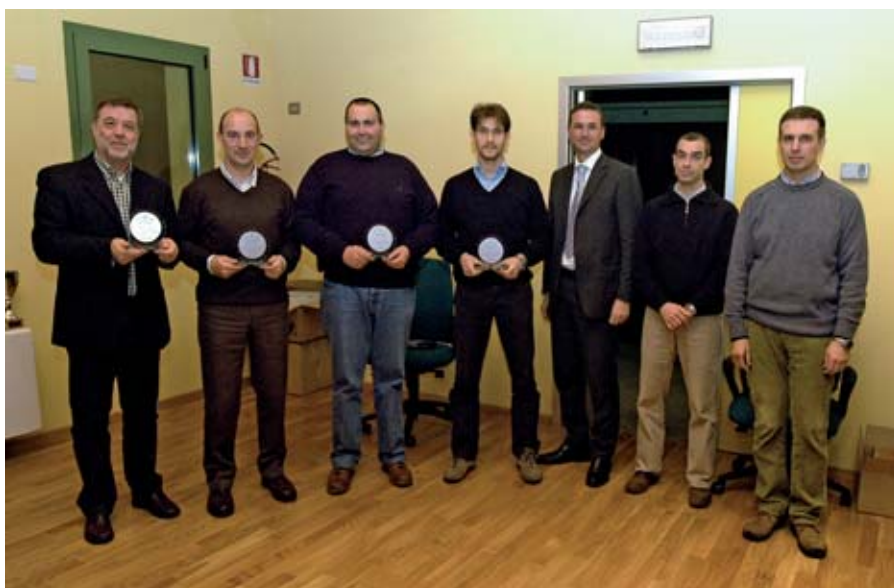
Le premiazioni per i 15 anni di attività con il Tc C10

E' stata la nuova e funzionale sala riunioni del centro comunale tennis Baldresca, alla presenza di numerosi soci ed atleti, ad ospitare l'assemblea annuale del Tennis Club C10. L'evento ha costituito l'occasione per festeggiare i 20 anni di attività del sodalizio tennistico. Il club è stato infatti fondato nel dicembre del 1986 per volontà di un gruppo di amici appassionati di tennis. Un anniversario importante, ricordato dai protagonisti di allora con parole commosse, che hanno tenuto a sottolineare come la filosofia iniziale sia rimasta sempre la stessa. Il C10 in questi quattro lustri ha continuamente cercato di proporre nuove attività, confrontandosi e traendo esempio da altre realtà tennistiche. Sono nate così, nuove e importanti collaborazioni che ne hanno permesso la crescita sportiva e organizzativa. A questo proposito vale la pena ricordare la "C10 Cup", giunta alla diciannovesima edizione, la Coppa "Città della Pace", i frequenti scambi con i club di Forchheim, Caprese Michelangelo e Sirmione, con i quali sono stati intrecciati gemellaggi non soltanto sportivi ma anche culturali, rinsaldando un'amicizia che è diventata via via sempre più solida. Numerosa e qualificata, in questi venti anni, è stata anche la partecipazione all'attività federale a squadre: dal campionato di serie C disputato nel